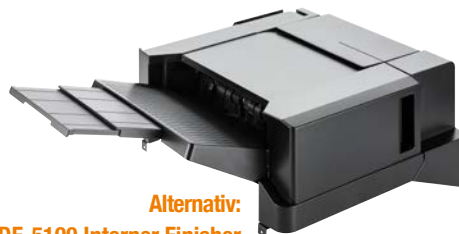
Alternativ: DF-5100 Interner Finisher (300 Blatt) mit Heftung (50 Blatt)