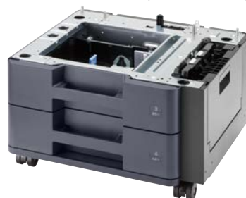
PF-5130 magasin universel (2 x 500 feuilles)