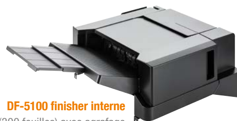
DF-5100 finisher interne (300 feuilles) avec agrafage (50 feuilles)