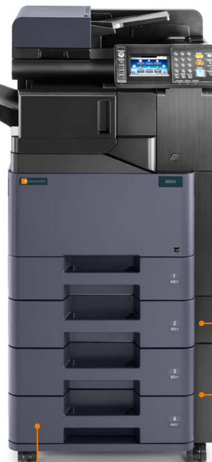
PF-5120 magasin universel (500 feuilles), nécessaire pour l'installation de PF-5130 ou PF-5140