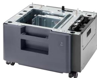
PF-5140 magasin grand format (2 000 feuilles)