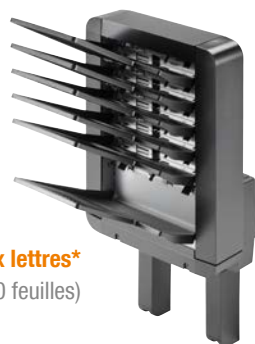
MT-5100 boîte aux lettres* (500 feuilles + 5 x 100 feuilles)